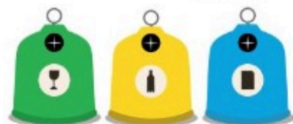
AINSI QU'UN POINT TRI Verre, emballages, papiers